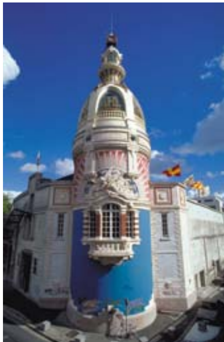
Ancienne usine LU qui se trouve au cœur de Nantes

Peux-tu écrire un slogan publicitaire pour LU ou pour BN qui donne envie aux autres de manger ces gâteaux !